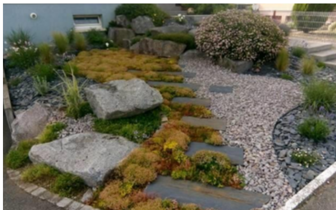
3 mois après l'installation