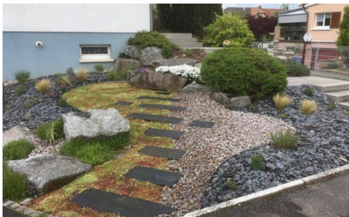
Le jour de l'installation